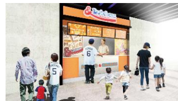
& Butchers イメージ

株式会社西武ライオンズ(本社：埼玉県所沢市、代表取締役社長：奥村 剛)では、2024 シーズンのプロ野球公式戦の開幕に先立ち、ベルーナドーム 1 塁側に「L's MEXICO」、 エルズ 「& Butchers」、 アンドブッチャーズ 「肉飯 とやま」、 にく 「麻婆豆腐専門店 SCRAMBLE」の4つの飲食店舗を新しくオープンいたします。