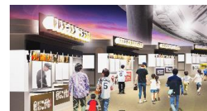
1 塁側提灯横丁 イメージ