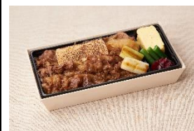
黒毛和牛のすき焼き重