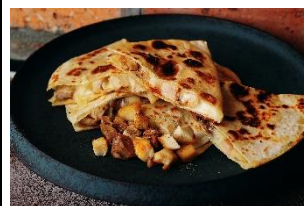
L's ケサディーヤ チキン