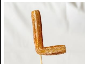
もちりチームチュロス