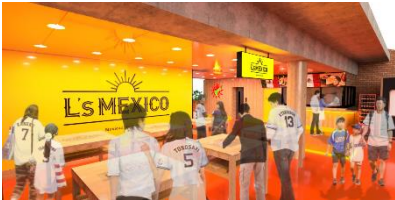
L's MEXICO イメージ