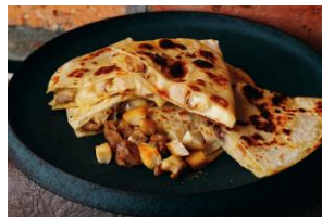
L's ケサディーヤ チキン